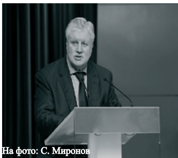
На фото: С. Миронов

Председатель Партии СПРАВЕДЛИВАЯ РОССИЯ, руководитель партийной фракции в Госдуме Сергей Миронов рассказал о начале подготовки к выборам в Государственную Думу VII созыва в 2016 году: