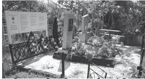
Это могила Героя Советского Союза А. Булгакова. Только за 2010 года могила дважды подвергалась разграблению. Вандалы уносили чугунные ограды. Коммерсанты принимают такой «металлолом»...

«ФедералПресс.Сибирь» напоминает, на днях в межмуниципальный отдел МВД России «Балеиский» от местных жителей поступило сообщение о том, что на кладбище возле села Унда неизвестные разгромили надгробные памятники, разбросали цветы и венки. Вандалы осквернили 47 могил.