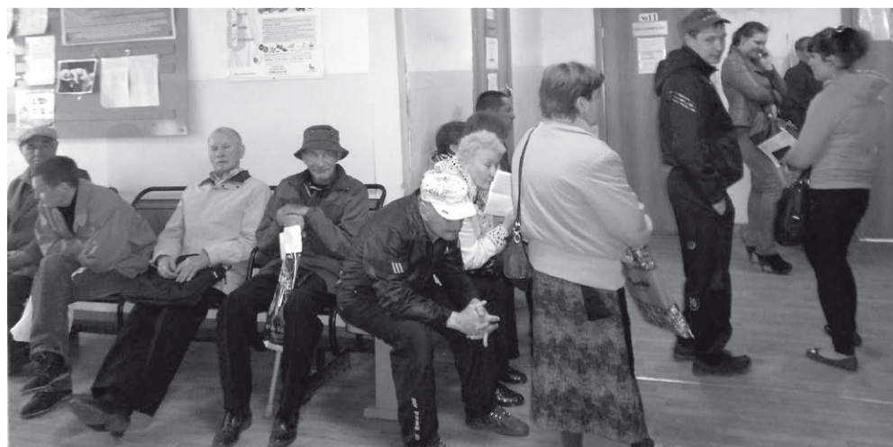
На снимке: пациенты в ожидании приема врачей. Читинская районная поликлиника. Май 2013 года.