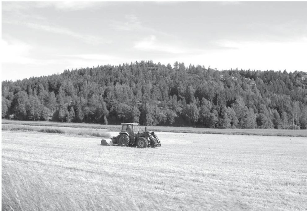
Так похоже на Забайкалье... Но это Швеция, которая на 90 процентов обеспечивает себя сельскохозяйственной продукцией.

В этом состоит коренное отличие от российской системы, где законодательство устанавливает перечень вопросов, решение которых относится к полномочиям органов местной власти, оставляя, таким образом, большую сферу ответственности государственной власти.