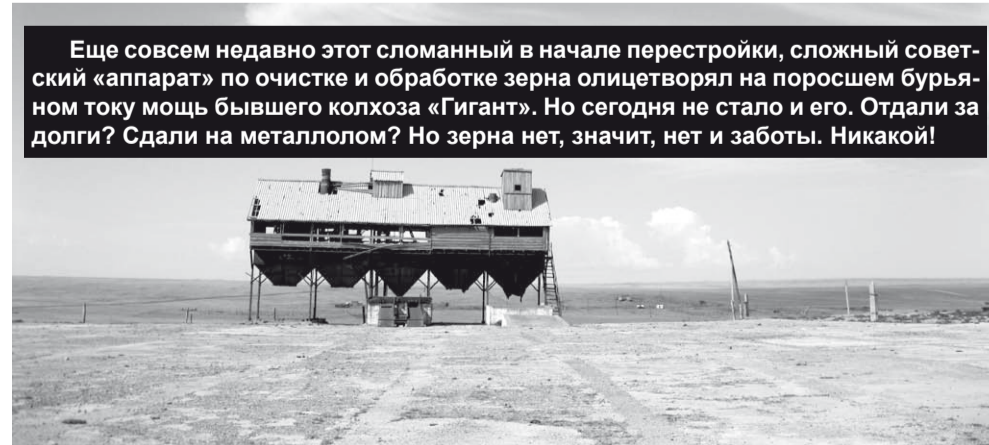
Еще совсем недавно этот сломанный в начале перестройки, сложный советский «аппарат» по очистке и обработке зерна олицетворял на поросшем бурьяном току мощь бывшего колхоза «Гигант». Но сегодня не стало и его. Отдали за долги? Сдали на металлолом? Но зерна нет, значит, нет и заботы. Никакой!

Это о них, заполонивших сегодня всюду структуры власти, полтора века назад писал человек, завершивший создание Забайкалья в его современных границах, граф Николай Николаевич Муравьев-Амурский: «Храни, Господи, Россию не от врагов и супостатов, а от мелочных и легкомысленных людей». Это и есть армия шпионов и предателей. Именно они послужили и служат усердно врагам России в XX и XXI веках, иные порой даже не подозревая об этом (вот кто лохи!). Создав невыносимые условия жизни, теперь они будут призывать к борьбе с этими же условиями.