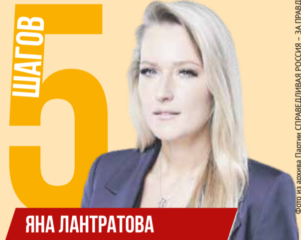
ЯНА ЛАНТРАТОВА Депутат Государственной Думы

Депутаты СПРАВЕДЛИВОЙ РОССИИ – ЗА ПРАВДУ внесли законопроект, в соответствии с которым следует отказаться от определения прожиточного минимума по медианной зарплате. Партия СПРАВЕДЛИВАЯ РОССИЯ – ЗА ПРАВДУ предлагает использовать метод, который учитывает натуральный состав продовольственной, непродовольственной корзины и платных услуг. Таким образом, ПМ (а вслед за ним МРОТ, размер пособий, доплат к пенсии и прочее) увеличится в разы! Вслед за ними вырастет и уровень жизни у самых бедных россиян.